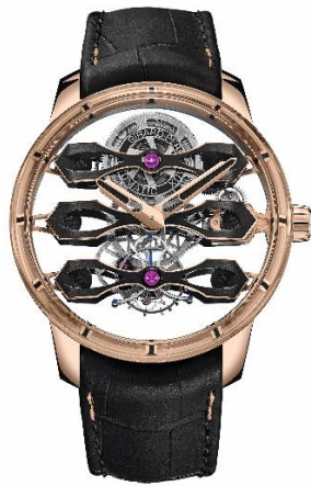
展品：芝柏表三飞桥陀飞轮腕表

今年正值 GP 芝柏表 230 周年诞辰。作为庆祝活动的一部分，GP 芝柏表以标志性变内藏于外露设计理念重新演绎其经典表款，注入现代风尚，推出全新三飞桥陀飞轮腕表。该款腕表首次采用贵金属材质，打造玫瑰金的三条 Neo Bridge 新板桥。同时，一个尤为鲜明的特色是其对于三维立体构造的巧妙运用，将不同表盘元素置于不同高度，这是世界高端建筑的常见特征。三飞桥陀飞轮腕表在演绎现代时尚的同时，坚守了高级制表业的代表性传统技艺。