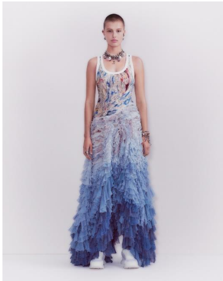
展品：Alexander McQueen 刺绣 T 恤礼服裙

亚历山大麦昆（Alexander McQueen）通过对技术的掌握和对文化、社会的借鉴，将创意变成了奢侈品。这条裙子的灵感来自 18 世纪英国诗人、画家和版画家 William Blake 为但丁《神曲》创作的插画图案。它聚焦阳光、空气，象征着生命的光辉在黑暗中诞生。这件展品以亚历山大麦昆的独特视角，用创新的技术把历史和艺术以现代的方式呈现。晚礼服融入了现代 T 恤元素，呈现既和谐又冲突的戏剧感。戏剧性的晚礼服变成了现代刺绣 t 恤。过去，现在和未来凝成了永恒。