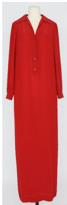
展品：SAINT LAURENT 红色缎面长款衬衫裙

古驰（Gucci）以其新系列《Aria-时尚咏叹调》中的白色竹节手袋展现了品牌历史传承。该手袋以1947年首款标志性竹节手袋为原型，饰以灵感来自马术配件的红绿织带宽肩带，以当代视角重塑品牌经典设计。在原材料、特别是皮革短缺的年代，品牌创始人引入竹节材料制作手袋把手，一经面世就获得了巨大的成功。这一经典手袋曾被许多名人使用，如英格丽·褒曼(Ingrid Bergman)、瓦妮莎·雷德格雷夫(Vanessa Redgrave)等。