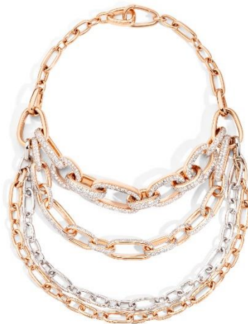
展品：Pomellato Iconica Bavarole 项链

Boucheron 宝诗龙的作品展示了现代精品的当代性和世家的创新精神。这是第一个富有生命力的高级珠宝品牌。通过与最先进的玻璃实验室合作，创意总监研发出一种全息材料，令宝石在保持原貌的同时，能够折射出无限变幻的光影色彩，就如同花卉的绽放会随着日照而变化。这枚作品生动地展示了在高级珠宝中利用并整合最先进的技术，让工艺散发出生命力。“永恒绽放”戒指是世家的标志性作品，完美结合最自然的元素和最先进的技术，致敬大自然中源源不绝的灵感。