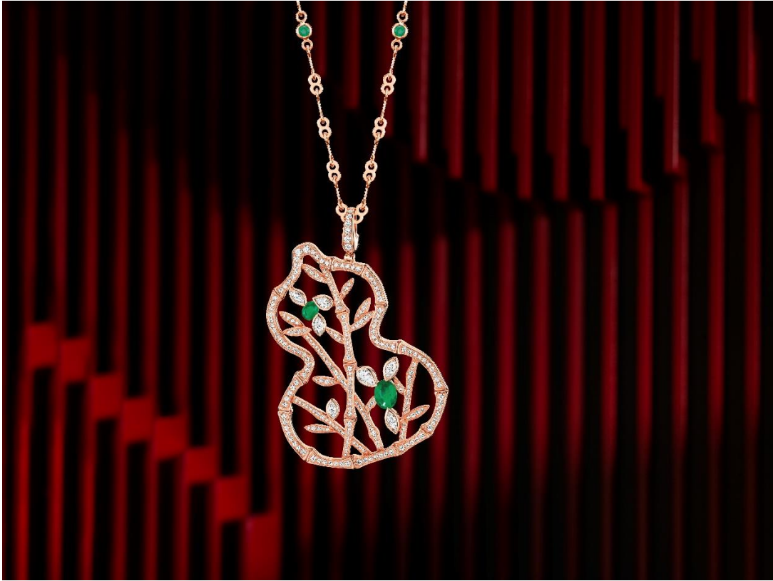
展品：Qeelin Wulu Bamboo Lace 项链

每一件展品是最能代表奢华精髓和最具象征意义的展品。在成为永恒和标志性的作品之前，每件作品首先是一种基于伟大愿景、人性化的和真实智慧的表达。Qeelin 珠宝的 Wulu 系列项链体现了上述一切：2004 年法国戛纳电影节红毯上，Wulu 系列首次惊艳亮相。著名演员张曼玉佩戴单支 Wulu 耳环，登上最佳女演员的领奖台，优雅展现了摩登迷人的东方风韵。Wulu 是 Qeelin 最具代表性的系列，将葫芦背后的神奇文化意涵转化为时尚象征，为我们的生活带来正能量的祝愿与美感。Wulu 谐音“福禄”，象征着召唤健康、幸运的护身符。葫芦的 8 字形状，与代表财富的“发”同音，象征着财源滚滚。Wulu 系列简约优雅，流畅和谐线条镶嵌着闪烁的钻石，是完美呈现 Qeelin 哲学——平衡与和谐，的最佳演绎。