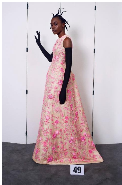
展品：Balenciaga 象牙白真丝粉色花卉刺绣造型长礼服

Bottega Veneta 的 Cassette 包精准地诠释了该品牌的基本理念 —— 品牌以其低调的风格和奢华的皮革制品而闻名。这款没有品牌标识的手袋的设计理念是“当你的名字已经足够”，又能很快因独特的皮革编织技术被辨认出来。这种于 20 世纪 70 年代初开发的编织技术被称为 intrecciato ，最近被品牌重新诠释。这是真正创新和品牌历久弥新完美结合的例子。品牌风格不会消逝，通过重新演绎得以永存。