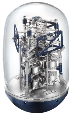
展品：雅典表 UFO 座钟

今年正值 GP 芝柏表 230 周年诞辰。作为庆祝活动的一部分，GP 芝柏表以标志性变内藏于外露设计理念重新演绎其经典表款，注入现代风尚，推出全新三飞桥陀飞轮腕表。该款腕表首次采用贵金属材质，打造玫瑰金的三条 Neo Bridge 新板桥。同时，一个尤为鲜明的特色是其对于三维立体构造的巧妙运用，将不同表盘元素置于不同高度，这是世界高端建筑的常见特征。三飞桥陀飞轮腕表在演绎现代时尚的同时，坚守了高级制表业的代表性传统技艺。