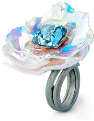
展品：Boucheron Holographic 戒指

Boucheron 宝诗龙的作品展示了现代精品的当代性和世家的创新精神。这是第一个富有生命力的高级珠宝品牌。通过与最先进的玻璃实验室合作，创意总监研发出一种全息材料，令宝石在保持原貌的同时，能够折射出无限变幻的光影色彩，就如同花卉的绽放会随着日照而变化。这枚作品生动地展示了在高级珠宝中利用并整合最先进的技术，让工艺散发出生命力。“永恒绽放”戒指是世家的标志性作品，完美结合最自然的元素和最先进的技术，致敬大自然中源源不绝的灵感。