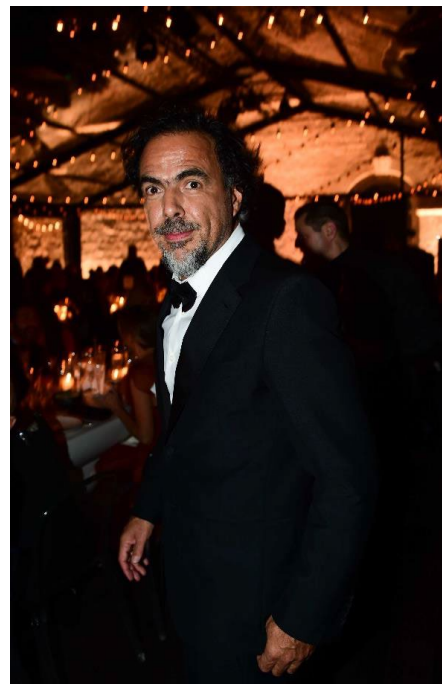
アレハンドロ・ゴンサレス・イニャリトウ