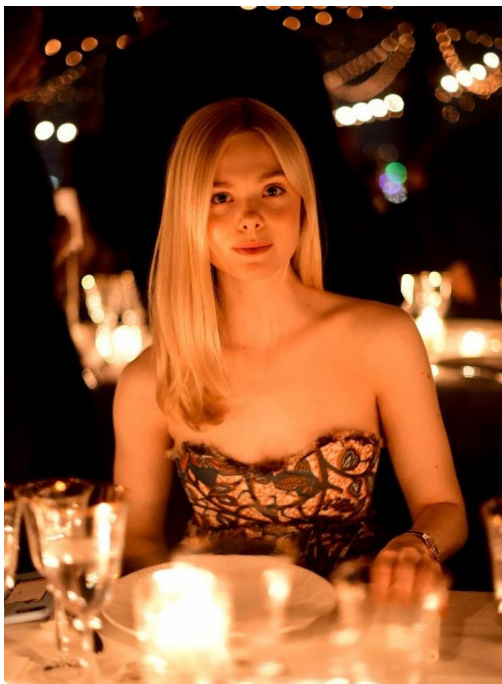
エル・ファニング