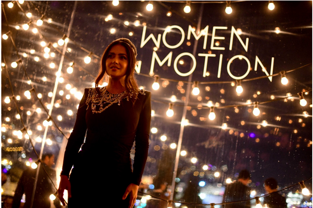
サルマ・ハエック・ピノー

パヴリコフスキ、ロバン・カンピヨ、ギヤスパー・ノエ、アーティスト/ライター/監督でもあるエンキ・ビラル、作曲家/ミュージシャンのジャン・ミッシェル・ジャールとトーマ・バンガルテル、サンローラン クリエイティブ・ディレクターのアンソニー・ヴァカレロ、グッチ最高経営責任者のマルコ・ビッツァーリ、サンローラン最高経営責任者のフランチェスカ・ベレッティーニ、モデルのトニ・ガーン、ミカ・アルガナラズ、アンジャ・ルービック、そしてインフルエンサーのカミラ・コエーリヨが出席しました。